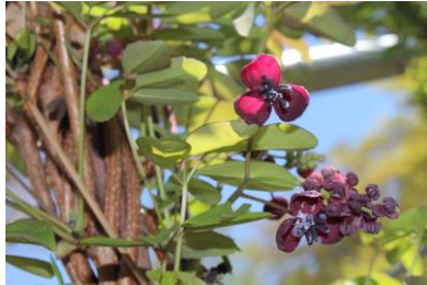
アケビの花 今年はいっぱい咲きました