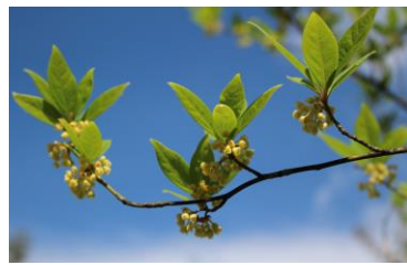
クロモジの花(楊枝のクロモジ)