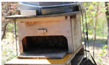
ニホンミツバチの養蜂箱 2年前から始めました