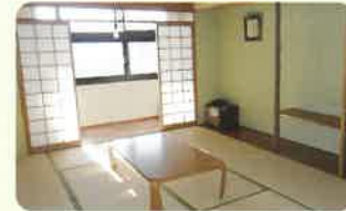
お部屋（和室と洋室があります）