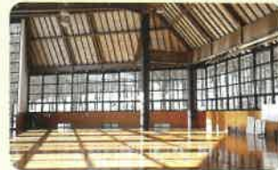
ワーキングホール